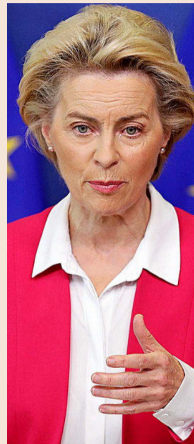
La presidenta de la Comisión Europea, Ursula von der Leyen.

Francia abogó por crear nuevos flujos de ingresos durante las negociaciones del año pasado, pero otros gobiernos miraron esos movimientos con descon-