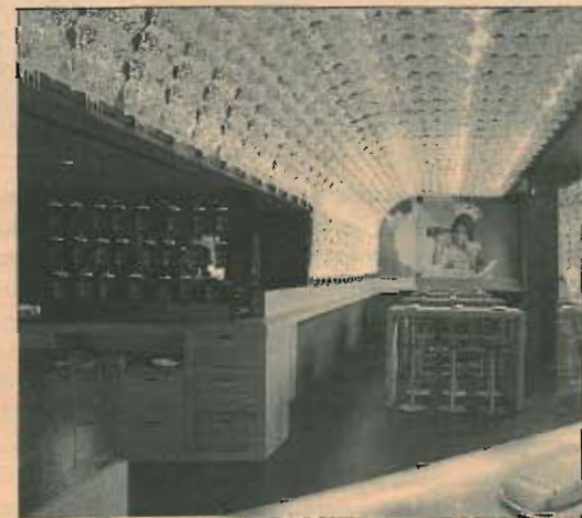
En la imagen, el interior de Estado Puro, en Madrid.

Ubicado en el NH Paseo del Prado (en la Plaza de Cánovas del Castillo, en el antiguo hotel Canarias, cuya gestión asumió hace unos meses la cadena presidida por Gabriele Burgio), este bar de tapas kitsch-pos-